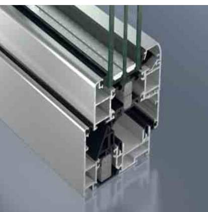
Schüco ASS 80 FD Schüco ASS 80 FD